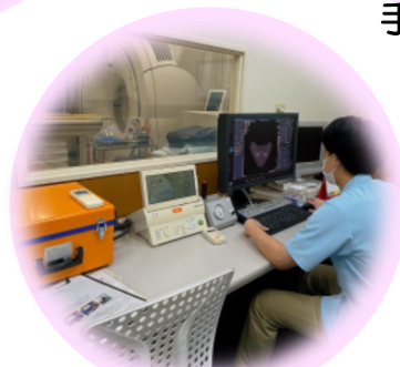
レントゲン・CT・ MRI検査補佐