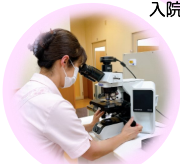
血液検査・尿検査・ 便検査等の実施