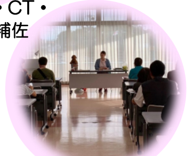
パピークラス・ 飼い主様向けセミナー