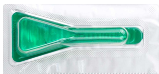
フロントライン(犬・猫)