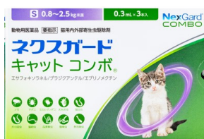
ネクスガードキャットコンボ(猫)