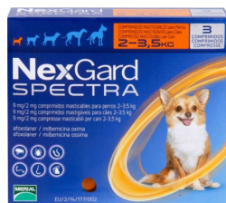
ネクスガードスペクトラ(犬)