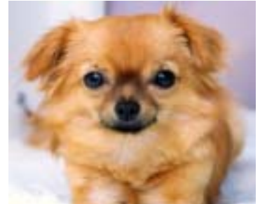
私の愛犬 カフェちゃん